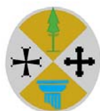
CONSIGLIO REGIONALE DELLA CALABRIA