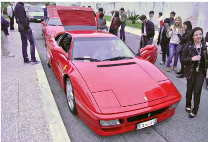
Immagini relative all'edizione 2011 della manifestazione